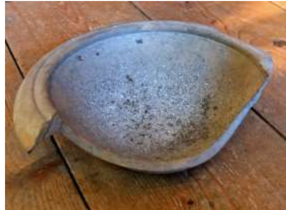
Reibschale zum Mahlen von Getreide oder zum Mörsern anderer Nahrungsmittel

Die römische Villa Otrang (Kr. Bitburg-Prüm) liegt etwa fünf Kilometer nördlich von Bitburg ( Beda ) an einem nach Südosten geöffneten Hanggelände nahe dem Fluss Kyll. Zur Villenanlage mit Wirtschaftshof gehört ein Tempelbezirk.