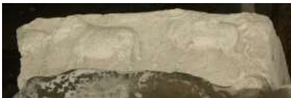
Berittener Schafhirte (Relief am Amphitheater;)

Echte Römerart sei Bauernart – so propagierte Cato die Rustikalität des Landlebens gegenüber dem „feinen“ Stadtleben (r.r.pr. 2), und auch Cicero verkündet, es gebe keinen Lebenserwerb, der besser, einträglicher, angenehmer und eines freien Menschen würdiger sei als die Landwirtschaft (off. I 151). Die Villa, der bäuerliche Betrieb, war in der Antike allerdings nicht die ländliche Idylle, die in der römischen Bukolik etwa eines Vergil heraufbeschworen wird. Dennoch waren die römischen Agrarschriftsteller der festen Überzeugung, dass gerade die landwirtschaftliche Tätigkeit den römischen Bürger zu einem besseren Menschen formte – moralisch, körperlich und ökonomisch. Das Landleben wird denn auch als Sittenspiegel für die Dekadenz und die Verfallserscheinungen in der zeitgenössischen städtischen Gesellschaft verwendet.