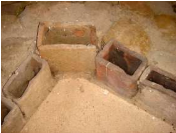
Hohlziegel der Warmluftheizung hinter dem Wandverputz (Villa Otrang)

Dort erhebt sich die Halle mit dem Warmbad, anschließend der Kosmetikraum von gleichen Ausmaßen, wenn man nicht das Becken und den Mauervorsprung im Bad, wo das heiße Wasser aus gewundenen Rohren hervorsprudelt, in Rechnung stellt. Im Inneren des Caldariums ist es taghell (...) 5. Daran schließt sich das kalte Bad an, das so groß ist, dass seine Becken den Vergleich mit den öffentlichen Bädern nicht zu scheuen brauchen (...) Die Abmessungen sind so groß, dass die Diener nicht behindert werden, selbst wenn alle vorgesehenen Plätze besetzt sind (...) An den Wänden fehlen die sonst üblichen etwas zweideutigen Badeszenen (...).