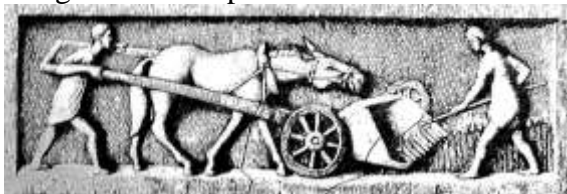
Gallische Mähmaschine ( vallus ) (Zeichnung: S. Martini; CC-BY-SA)

Durch diese Art der Anordnung von Haupt- und Nebengebäuden sind zwei Grundformen erkennbar: Bei der häufiger vorkommenden ersten Form sind die einzelnen Gebäude, gruppiert um einen Innenhof, über das umzäunte Hofgelände verteilt. Bei der zweiten Form liegt das Hauptgebäude üblicherweise an einer der beiden Schmalseiten eines langrechteckigen Hofes; die Nebengebäude befinden sich an den Langseiten. In Speicherbauten ( horrea ) mit durch Pfeilern oder Mauern erhöhten Böden wurde das Getreide trocken und sicher vor Ungeziefer gelagert. Stallungen sind anhand von Futterkrippen und Jaucheablaufrippen erkennbar. Nachweise handwerklicher Tätigkeit in den Wirtschaftsgebäuden belegen Metallverarbeitung, Töpferaktivitäten, Ziegel- und Glasproduktion.