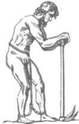
An den Füßen gefesselter Ackerbausklave (Simone Martini, Skizze nach K.-W. Weeber, Alltag im alten Rom, Düsseldorf-Zürich 2000, S. 13; CC-BY-SA)

Villen zurückgehen. In den landwirtschaftlichen Partien der Villenanlagen ( pars rustica und pars fructuaria ) wurden über den eigenen Bedarf hinaus für einen größeren Markt Nahrungsmittel, Kleidung, Töpfer- und Glaswaren sowie Genussmittel wie Wein, Bier und Honig hergestellt.