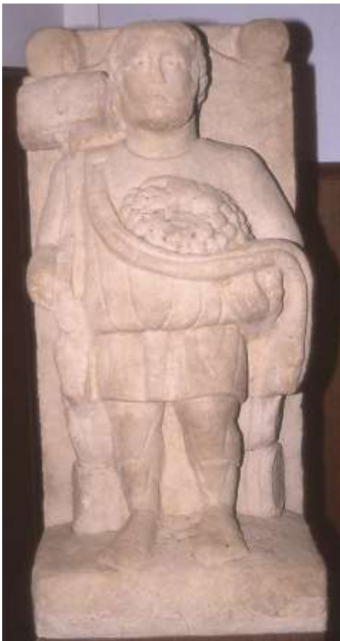
Abguss der Skulptur des römischen Weingottes Sucellus.

Während der Germaneneinfälle des 3. Jh. n. Chr. wurden zahlreiche Villen in Schutt und Asche gelegt. Im 4. Jh. n. Chr. wurden dann manche Gebäude dieser Anlagen in wesentlich kleinerer Form wiederaufgebaut und bis zu weiteren Übergriffen im 5. Jh. bewohnt.