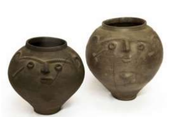
Gefäße: aus dem 2. und 3. Jahrhundert n. Chr. gewöhnliche römische Haushaltware.

Wein angebaut, die Wolle der gallischen Schafe war, wie der Schinken der einheimischen Schweine, überaus beliebt und bis nach Italien bekannt. In städtischen und ländlichen Handwerksbetrieben wurden Metall-, Glas- und Töpferwaren hergestellt; Gerbereien und Webereien entsprachen der Nachfrage nach Kleidung. Für die Versorgung von Bevölkerung und Armeen grundlegend waren die zahlreichen Villen des Mosellandes.